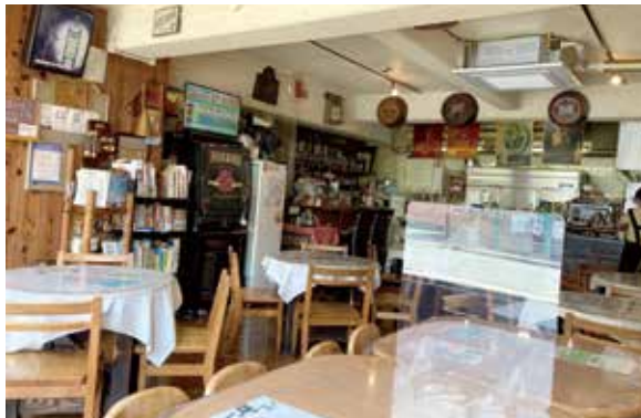
1987年から京都で愛されるハンバーガーショップ「SPEAK EASY」 「ブラックファスト」は最初は11時までだったのが少しずつ延長して17時に。 人気の「京都バーガー」には、豆腐の白和えやしば漬けが入っている https://www.speakeasy.gr.jp/

——私にも20代の娘がいますが失敗を恐れる世代と感じます。失敗談を聞く経験が少ないかもしれません。